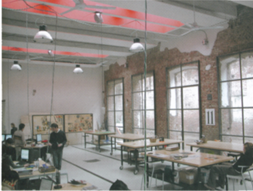
Les ateliers Oneoff