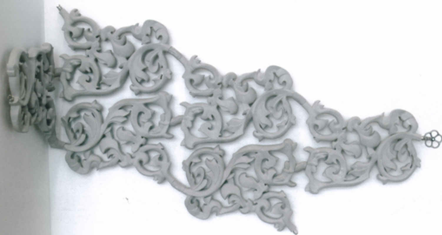
Radiateur en foute, design Joris Laarman

Bon nombre d'écoles profitent de la vitrine milanaise en avril, pour présenter leurs travaux. Un travail qui entraîne les étudiants à produire et à organiser des événements. Chaque année, l'ECAL (Ecole Cantonale d'Art de Lausanne), la Design Academy d'Eindhoven, retiennent l'attention, cette année la faculté de design de Bolzano s'est également exprimée. L'initiative du studio de prototypage rapide Oneoff en collaboration avec une trentaine de designers participait à la qualité de ces initiatives collectives.